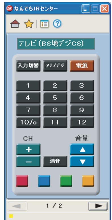
「なんでもIRセンター」画面

その他すべてのブランド名と製品名、商標、および登録商標は、それぞれの権利者の所有物です。