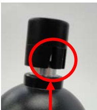
（ここを持ち上げる）