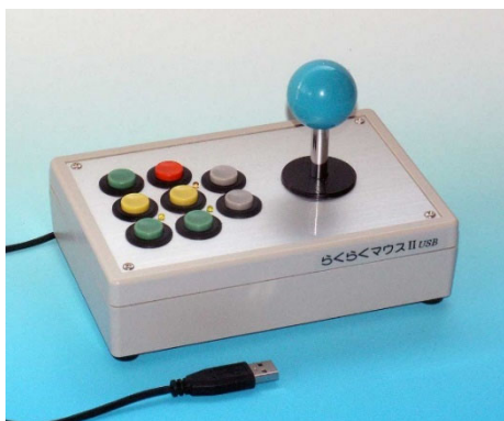
らくらくマウスII ジョイスティック型

主に上肢機能障害など身体障害の方に使用されており、特別支援学校や支援施設、職場で仕事に使っているという方もいます。パソコンやインターネットは、障害のある方にとっても大変便利なコミュニケーションの道具であると同時に、現代において「情報」は基本的人権ともいえるものになりました。全国の障害がある方に24年間で5,000台をお届けし、様々な場面で活用していただいていることを製作の励みとして、できるだけ価格を抑える努力を続けてきました。