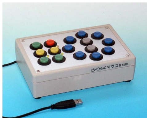
らくらくマウスII ボタン型