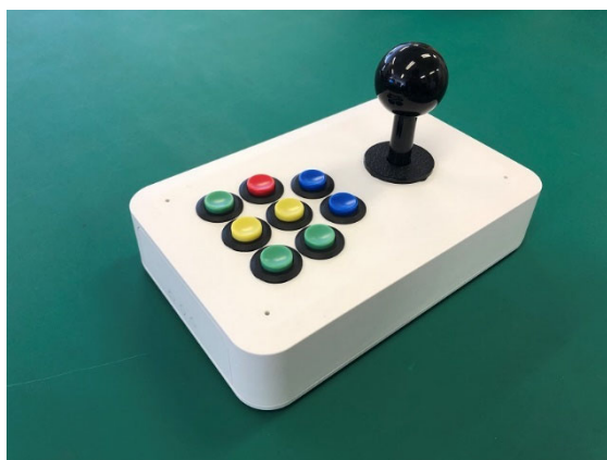
らくらくマウスⅢ試作品

「らくらくマウスを継続させたい」という想いで継承先に手を挙げ、こことステップさんから選ばれたことに大変感謝していると同時に、後継機種の開発を成功させ、なにより今後も提供し続けていかなければという責任を感じております。その継続性という観点からやむを得ず、「らくらくマウスⅢ」の販売価格を従来よりも引き上げることとなりますが、クラウドファンディングで開発費をカバーすることにより上げ幅を抑えるとともに、ご支援の特典として安価に入手できるメニューを用意しました。皆様のご理解とご協力をお願いいたします。 (※) iPad, iPhone は Apple Inc. の商標です。