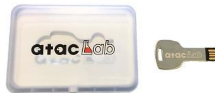
OAK Cam USB メモリ版